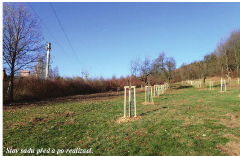
Stav sadu před a po realizaci.

zdravotní stav ohrožoval okolní prostor a zároveň tyto stromy nebyly domovem vzácných a chráněných druhů živočichů. Následně bylo vysazeno 37 kusů ovocných dřevin, včetně dvou ořešáků královských. Tyto dřeviny byly zabez-