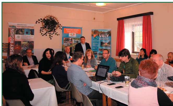
Dny Železnohorského regionu