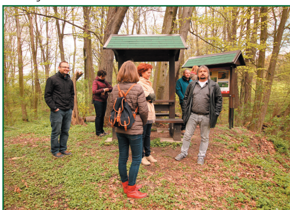
Meandry Struhy Valy