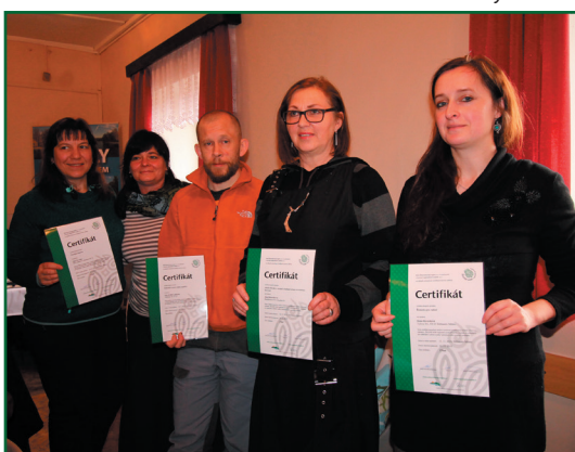
Předání certifikátů ŽELEZNÉ HORY, regionální produkt