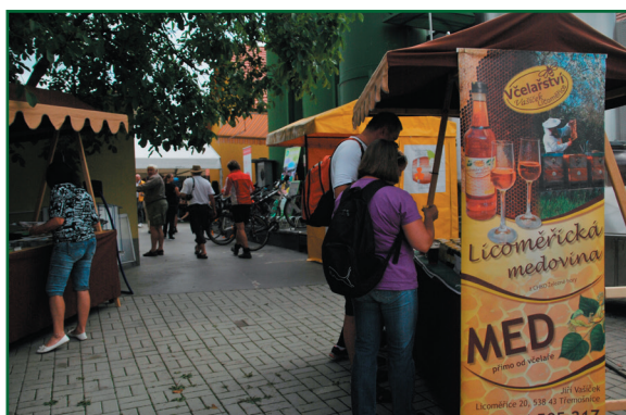
Regionální výrobky Žlebské Chvalovice