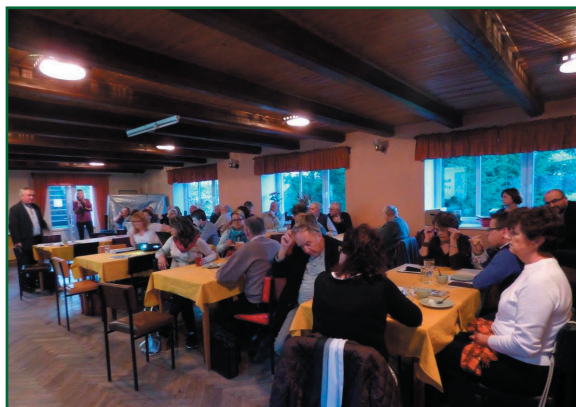
Valná hromada MAS ŽH v Bukovině u Přelouče

Místní Akční Skupina ŽELEZNOHORSKÝ REGION, z. s.