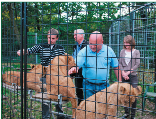
Návštěva MAS Radošínka, Slovensko