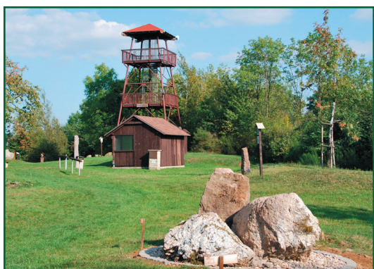
Geolokalita Národního geoparku Železné hory na Barborce