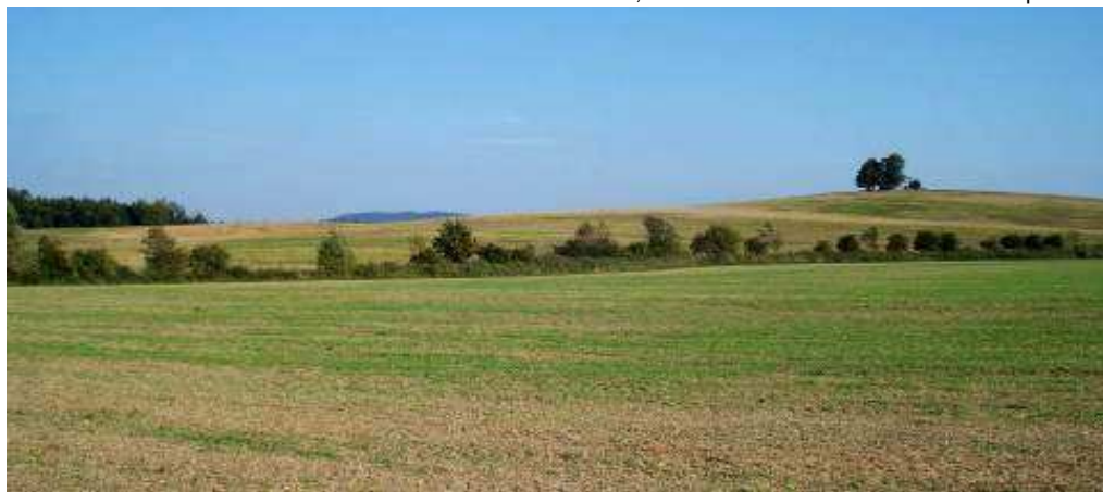
POHLED OD JZ

Diviš, J. : Osídlení širšího okolí Příbora od pravěku do raného středověku, Nový Jičín 2003