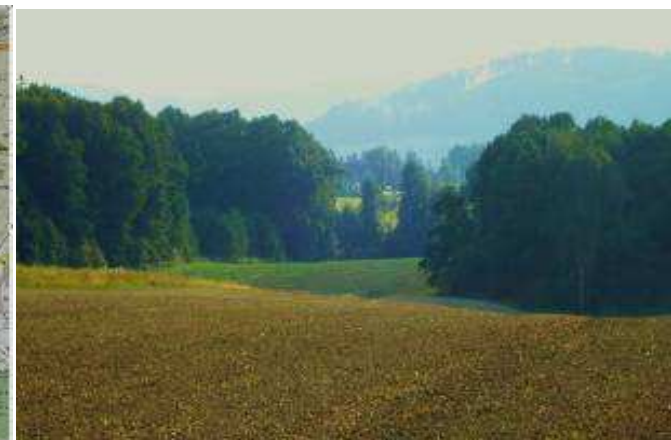
Příbor - Statek