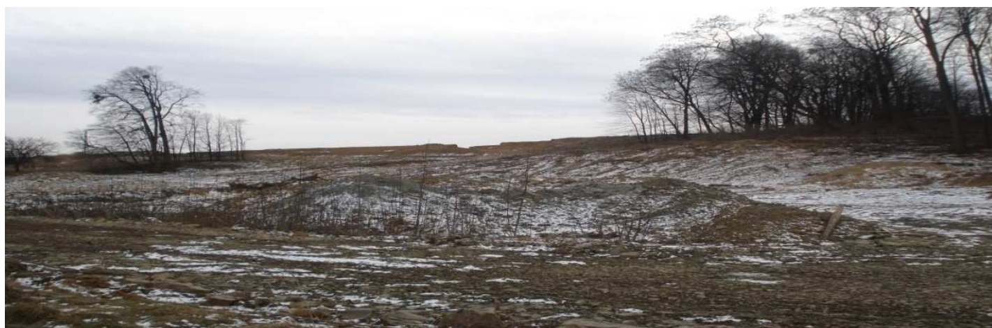
Pohled na lokalitu Hladké Životice 1 b. ze severní strany od Husího potoka před výstavbou silnice a mostu.