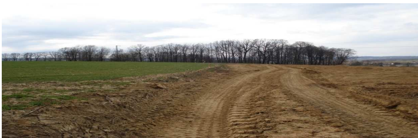
Pohled na lokalitu Hladké Životice 1 b. od východní strany, narušený objekt leží na okraji skrývky ornice.